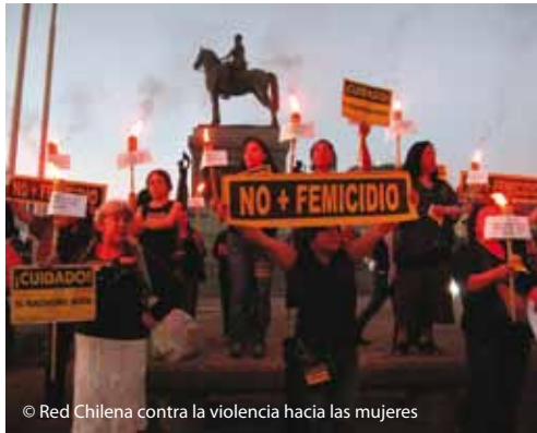
© Red Chilena contra la violencia hacia las mujeres

lado, no se ha construido información relevante a la hora de elaborar políticas públicas preventivas y de reparación para los casos de suicidios de mujeres agobiadas por la violencia constante de sus parejas, o en aquellos casos en que las mujeres matan a los agresores en defensa propia, cuando su propia vida está en riesgo.