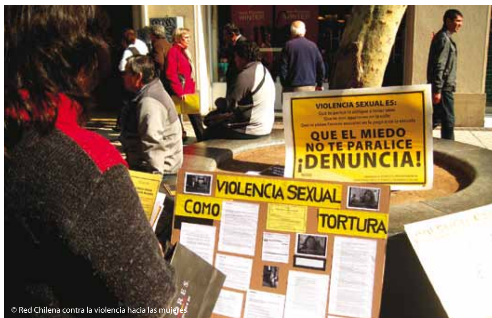
© Red Chilena contra la violencia hacia las mujeres

a la seguridad nacional, veremos una gran diferencia fiscal. Los delitos como narcotráfico, secuestro y tráfico de armas o trata de personas, tienen una jerarquía en el imaginario de quienes trabajan el tema de seguridad , que no admite comparación ni asociación con aquellos relacionados con la violencia basada en el género.